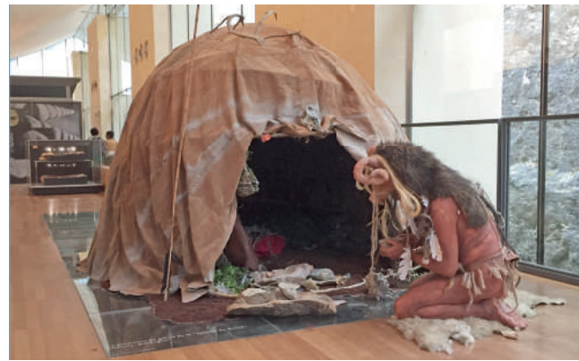
La compagnie Le Diable par la Queue – Nuit européenne des musées 2018