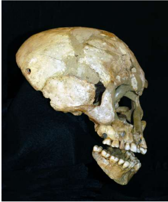
crâne trophée de Faïd SouarII