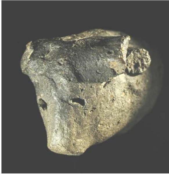
statuette tête de bovidé modelée en terre cuite, Tilemsi, site du km 110 dimension 2,6 cm, cliché P. Jugie, MNP, dist RMN