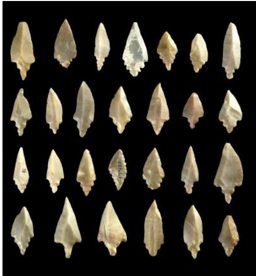
pointes de flèches typiques du Néolithique de la vallée du Tilemsi, dimension environ 4 cm, site d'Ebelet (Mali)