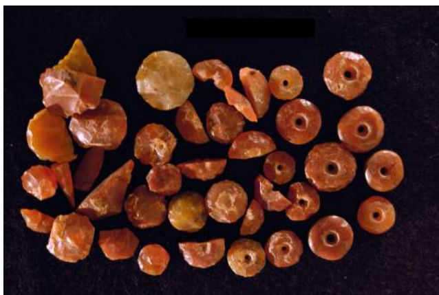
perles en cornaline à divers stades de fabrication depuis les premières phases du débitage à gauche de la photo jusqu'aux