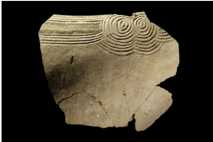
fragment de céramique décorée, dimension 17 cm, site du km 110, Tilemsi (Mali), cliché P. Jugie, MNP, dist RMN