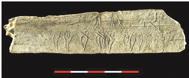
Abri du château, Les Eyzies (Dordogne) Paléolithique supérieur - Magdalénien supérieur Côte (os) 131 x 40 mm

1/ Humm... pas facile de déchiffrer de fines gravures exécutées il y a 13 000 ans sur une côte d'herbivore. Retrouve à quelle zone de l'object A, B, C et D correspondent les relevés 1, 2, 3 et 4.