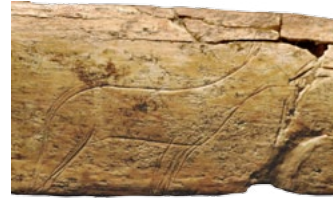
Animal gravé sur os, Arancou (Pyrénées Atlantiques), Magdalénien supérieur

15h30 | Atelier d'initiation aux relevés d'art mobilier. Animation gratuite après acquittement du droit d'entrée.