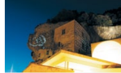
Création O. Couzel et V. Bersars

Vidéoprojections monumentales sur les falaises et le château des Eyzies, tous les soirs en juillet et août de la tombée de la nuit à minuit.