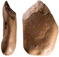
Galet aménagé acheuléen, calcaire, Caune de l'Arago, -450 000 ans

Les travaux et nouvelles données collectées ces vingt dernières années ont renouvelé les connaissances sur les premières occupations humaines de l'Europe de l'ouest et plus particulièrement de la France. Cette exposition présente les diverses étapes de cette conquête en soulignant des aspects chronologiques, environnementaux et culturels.