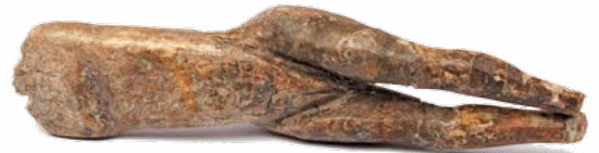
Vénus impudique , ivoire de mammoth, Laugerie-Basse (Dordogne), Musée de l'Homme (Paris)

Conférence suivie d'une séance de dédicace de son ouvrage L'art des objets de la Préhistoire . Entrée libre