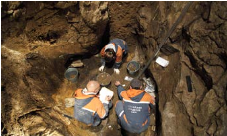
Fouille de la galerie est de la grotte de Denisova

Une phalange humaine est découverte en 2008 dans la grotte de Denisova, au sud de la Sibérie. Rien ne laissait présager que de l'analyse de ce vestige vieux de quarante à cinquante millénaires surgiraient les gènes d'un troisième Homme, un cousin inconnu. Deux acteurs occupaient alors l'immense territoire de l'ouest de l'Eurasie : l'homme de Neandertal et l'Homme anatomiquement moderne. Dans l'Altai, au moins, une troisième humanité existait, restée insoupçonnée. En effet, elle avait développé des traditions techniques et des formes d'expressions symboliques semblables à celles des deux autres... Mais de la rencontre de ces trois humanités, seuls nos ancêtres biologiques directs subsisteront.