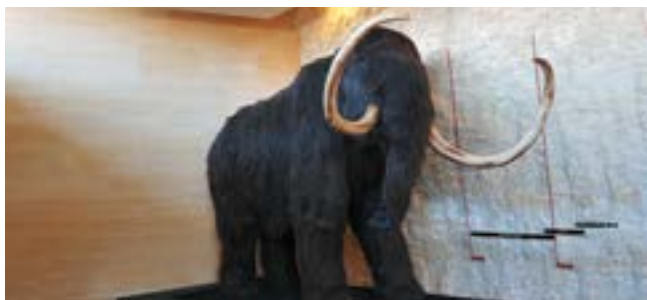
Reconstitution de mammouth en taille réelle (h : 3m75), création Jack Thiney, Musée national d'Histoire naturelle (Paris)

Cette exposition constitue la contribution du Musée national de Préhistoire à perpétuer cette « mémoire de mammouth ».