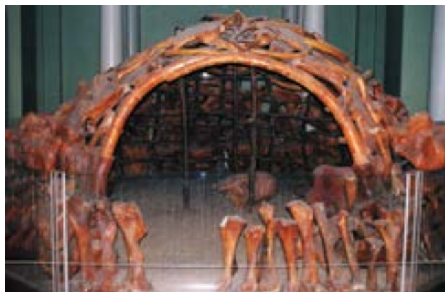
Reconstitution de l'habitation n°1 en ossements de mammouths découverte à Mezhyrych (Ukraine), Musée de Paléontologie de Kiev