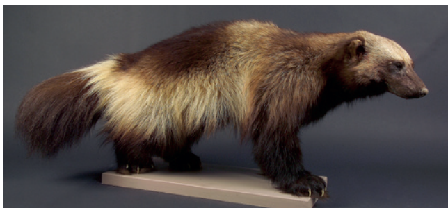
Glouton ( Gulo gulo Linnaeus 1758), Taxidermie de Joseph Kawerk, musée des Confluences (Lyon)

Aujourd'hui, l'omniprésence de l'Homme sur Terre et son intervention sur l'environnement ont modifié les équilibres passés. Cette exposition, en partenariat avec divers organismes de gestion du milieu naturel, offre également une ouverture sur la biodiversité actuelle en France au travers de quelques réflexions et exemples d'actions concrètes.