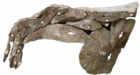
Kokiselei 5, Ouest du lac Turkana (Kenya), 1,77 millions d'années, remontage de 31 éclats